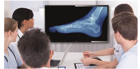
Imagen digital clínica

La imagen digital te ayuda a revisar y analizar imágenes clínicas con un rendimiento de visualización coherente y preciso. Para conseguir realizar interpretaciones clínicas fiables, nuestras pantallas profesionales se suministran calibradas de fábrica con el fin de ofrecer un rendimiento de visualización estándar en escala de grises optimizado. Gracias a la imagen digital, destacará en todos los aspectos del cuidado del paciente.